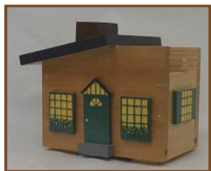
①貯金箱《片屋根》 料金: 1,500 円