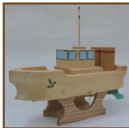
③ふね 料金: 1,000 円

1 日体験教室申込み : 工房にて定員になるまで受付いたします。電話 (9:00 ~ 16:00) でも受付できます。 (都合により日程・内容を変更する場合があります。ご了承ください。)