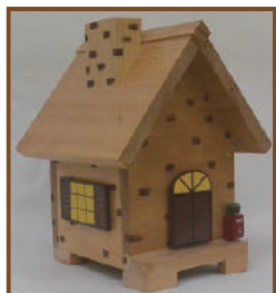
②貯金箱《両屋根》 料金: 2,000 円