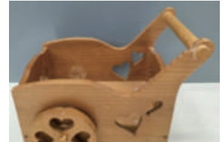
② ワゴン ※色塗り不可

《定員》先着 ①2名 ②10名（いずれも要予約） 《料金》①ミニチュア椅子 2,500円 ②ワゴン（色塗りできません）1,500円