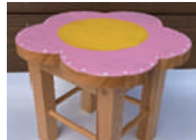
① ミニチュア椅子 【お座り可】

《講習日》団体利用のない開館日 ※12時～13時はお昼休憩です 《対象》小学生以上（小学生6年生以下は要保護者）