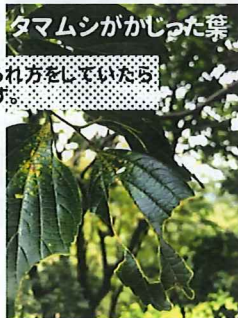
タマムシがかじった葉