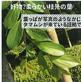
好物?柔らかい枝先の葉