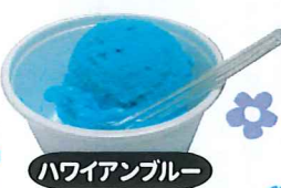
ハワイアンブルー