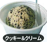
クッキー&クリーム

バニラ・ストロベリー・チョコレート・抹茶・チョコミント・珈琲&ゼリー・クッキー&クリーム・ヨーグルト・ハワイアンブルー・巨峰・オレンジ・マスクメロン・マミー味・森永プリン味