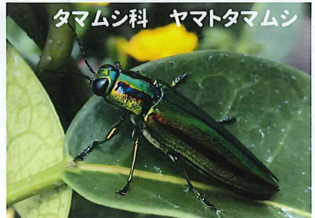
タマムシ科 ヤマトタマムシ

皆様こんにちは。今日は先日から予告していたヤマトタマムシの紹介を致します。ようやくヤマトタマムシの季節になりました。こどもの国では7月中～下旬頃から見られるようです。ヤマトタマムシの成虫はエノキの葉っぱを食べるため天気の良い日はエノキの樹冠(木の上の方)を飛びかっています。