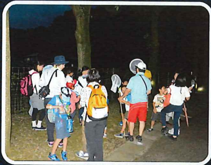
初めて羽化を見る参加者も多く一生懸命カメラで写真を撮っていました！

7月23日(土)と24日(日)の2日連続で『ナイトハイク』が行われました。23日はボランティア団体の「自然ふれあいクラブ」主催で行われ、7家族26名が参加。24日はこどもの国の主催で8家族20名の参加がありました。 両日とも、野外ステーションやふれあい工房、かくれんぼの丘等といった、園内各所でアブラゼミの羽化と遭遇することができ、参加された皆様も早速カメラを向けてセミの羽化の写真を撮っていました。 山際道路を歩くと側溝の流れの中にエビを発見したり、湿性植物園の近くでは、夜行性のカラスウリの花を見つけたりと、夜ならではの出会いもありました。