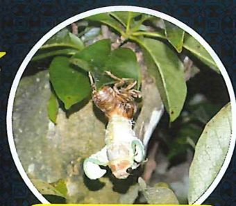
夕方~8時くらいに行われる！ アブラゼミの羽化が見られたよ！