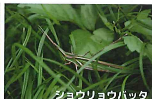
ショウリョウバッタ