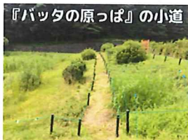
『バッタの原っぱ』の小道