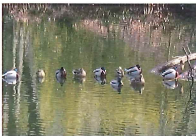
しも池とかみ池では マガモが見られます カメラが沢山てくす

ウビタキ等が見られました。また、こどもの国の2つの池では、キセキレイ・カワセミ・カワウ・マガモ・コガモも見られました。最後に野外ステージのところで鳥合わせをしたら38種の鳥が見られました。参加された皆様たくさん鳥が見られたので満足していただきました。