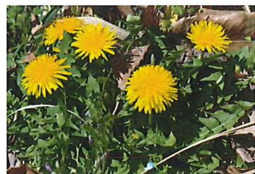
セイヨウタンポポ