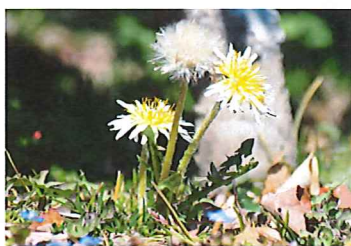
シロバナタンポポ

昆虫については、キタキチョウやヤマトシジミ・キタテハ・ヒオドシチョウ・ミヤマセセリ等が見られる様になってきます。