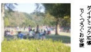
ダイナミック広場 多くの子ども達