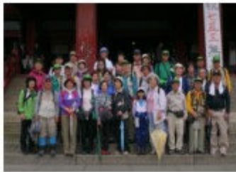
参加者全員でハイチーズ!