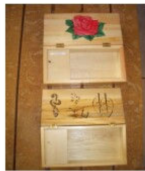
◎手作りのオルゴール!

今回は雨でしたが、来年の秋の七草寺めぐりは快晴である事を期待してウォーキング教室となりました。