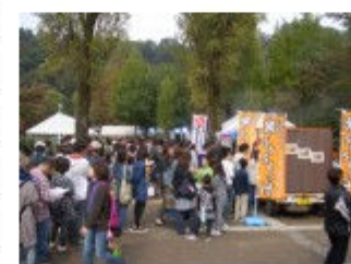
おおたの味を求めてアテコチに長い行列が