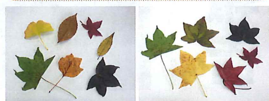
色々な形の葉っぱ 同じ葉っぱの色違い