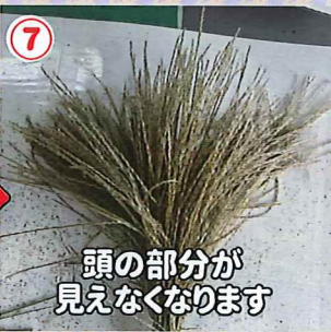
⑦ 頭の部分が見えなくなります

頭の周りを全て囲い終わった状態。バラバラにならないように根本を輪ゴムで束ねます。