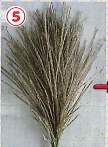
⑤ 20本（体用）を用意します。