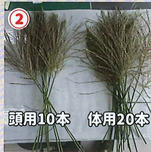
② 頭用10本 体用20本