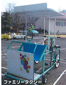
ファミリータクシー