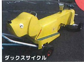
ダックスサイクル