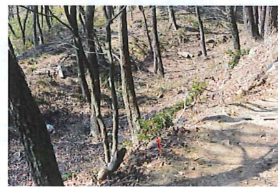
↑大八王子山～中八王子山 横堀の遺構と土塁

中八王子山の頂上では、頂上を取り囲むように空堀の遺構が見られました。説明によると、ここを破られると実城が丸見えになってしまうとのことでした。小八王子山での休憩後、金山城ガイダンスへ向かいました。道中には数多くの武者だまりの跡があちこちに見られました。金山城ガイダンスで昼食と施設の見学をし、こどもの国に帰ってきました。今回、説明がないと分からない様な発掘の場所や、普段なかなか見られない場所などもあったので、参加された皆様の満足度も高かったです。