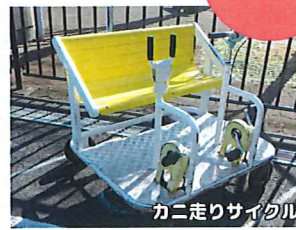
カニ走りサイクル