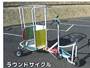
ラウンドサイクル