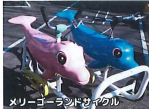
メリーゴーランドサイクル