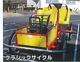
クラシックサイクル