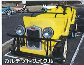
カルテットサイクル