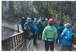
↑橋の井戸の説明を聞く参加者

その後、中八王子山に向かう山道のそばで横堀と連絡通路と思われる遺構が見られました。遺構は後北条の時代に造られたものだそう、障子の様な細い通路と深い濠の組合せの濠ではないかとの事でした。