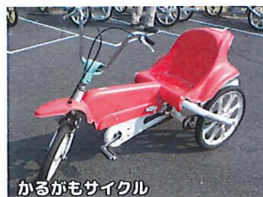
かるがもサイクル