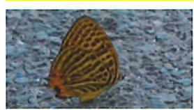
ウラナミアカシジミ