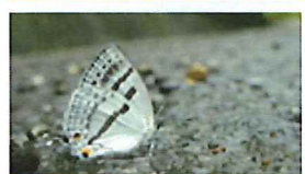
ミスイロオナガシジミ