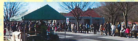
豚汁配布に並ぶお客様の大行列↓

11日（月）の祝日に大人も子どもも楽しめる素朴な遊び、「昔遊び体験と輪投げ」を開催しました。今回はコマ回し・けん玉・竹馬・ペーゴマ・輪ゴム銃・吹き矢・輪投げの7種類の遊びを用意し、370名程の子どもや保護者の皆様にも昔も変わらない楽しさに夢中になってもらえました。