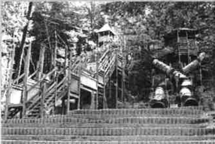
↑ 工事前の【冒険のとりで】 ↓ 同【パノラマチェア】