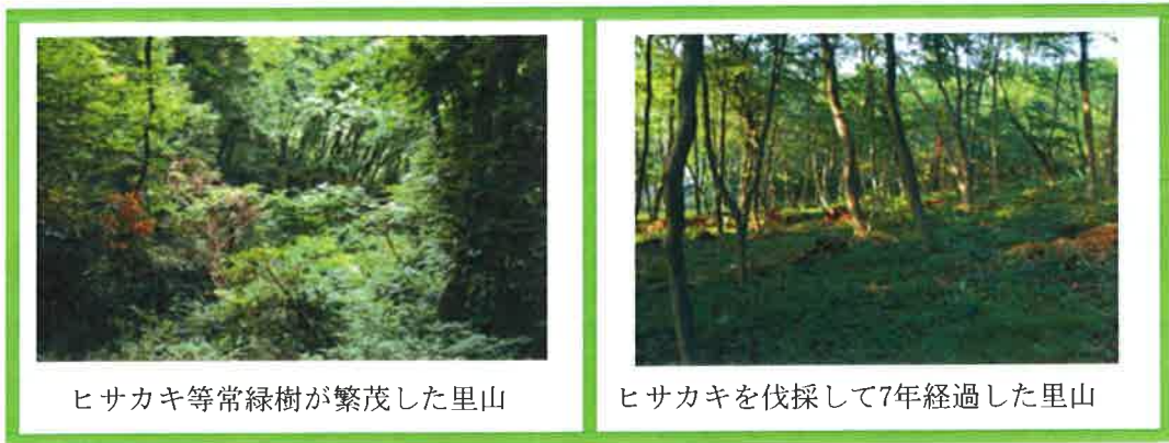
ヒサカキ等常緑樹が繁茂した里山