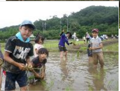
←みんな上手に植えられたかな？

か無事に終了する事が出来ました。 次回は、8月4日(日)「稲の生育状況・生き物観察」です。