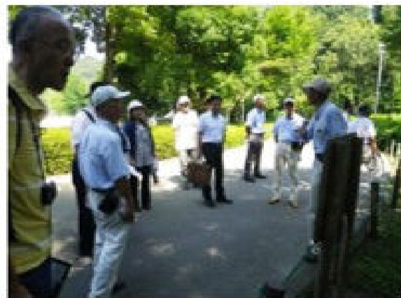
評価委員による現地調査

7月21日(土)～8月31日(金)の約1ヶ月間、夏休みに子ども達に楽しんでんでもらおうと、「かくれにこっこちゃんを探せ」イベントを実施しました。内容は園内にかくれにこっこちゃんを探し、キーワードを手に入れ、そのポイントごとに賞品をゲットするというスタンプラリー方式です。 今回初めて約1カ月にわたる長期間のイベントでしたが、最高の10ポイントまで到達するのにも「熊谷から3回も来たよ!」という子ども達もおり賞品と交換する時の嬉しそうな表情がとても印象的でした。また、今回の賞品であったこどもの国オリジナルカード(公園の蝶・花・鳥の写真)は大好評でした。