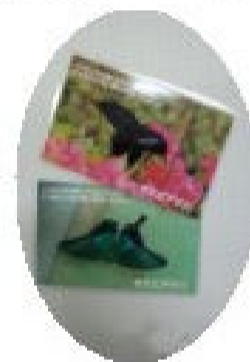
大好評だった オリジナルカード

7月21日(土)～8月31日(金)の約1ヶ月間、夏休みに子ども達に楽しんでんでもらおうと、「かくれにこっこちゃんを探せ」イベントを実施しました。内容は園内にかくれにこっこちゃんを探し、キーワードを手に入れ、そのポイントごとに賞品をゲットするというスタンプラリー方式です。 今回初めて約1カ月にわたる長期間のイベントでしたが、最高の10ポイントまで到達するのにも「熊谷から3回も来たよ!」という子ども達もおり賞品と交換する時の嬉しそうな表情がとても印象的でした。また、今回の賞品であったこどもの国オリジナルカード(公園の蝶・花・鳥の写真)は大好評でした。