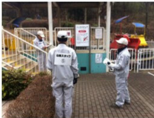
山麓駅における避難誘導指示

2月6日(月)、パノラマチェアにおける震災時の避難誘導訓練を実施しました。こどもの国で震度5以上の地震が発生したことを想定し、パノラマチェア・山頂駅・山麓駅からそれぞれどのルートを使ってどのようなお客様を避難させるかを現地で実施しました。実際に「現場担当者」「お客様」「第